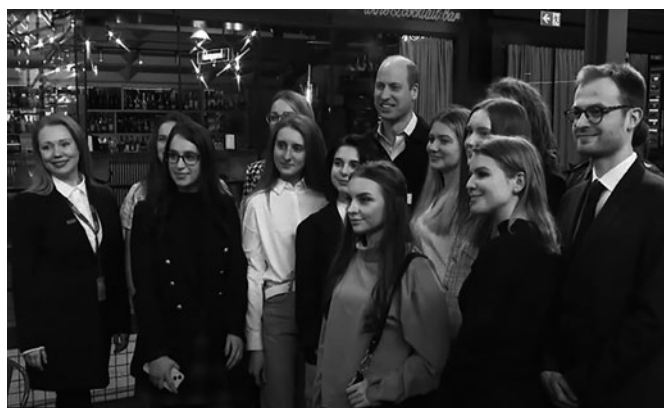
Представники Українського освітнього хабу зустрілися з Принцом Уельським Вільямом

Цей проєкт реалізується за ініціативи Міністерства освіти і науки України, Державної наукової установи “Інститут модернізації змісту освіти”, а також Асоціації інноваційної та цифрової освіти.