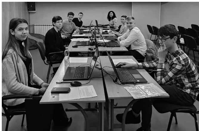
Фінальні змагання Всеукраїнських учнівських олімпіад з навчальних предметів проведено з використанням дистанційного формату

Підтримати прагнення молоді знати державну мову допоміг III Всеукраїнський відкритий марафон з української мови. В умовах війни до марафону доєдналися понад 20 тисяч учнів та студентів, які перебувають як в Україні, так і за її кордоном.