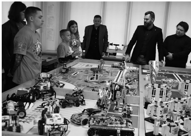
Всеукраїнський полігон “STEM-освіта: можливості для майбутнього”

мендацій щодо реалізації STEM-технологій в освітній процес.