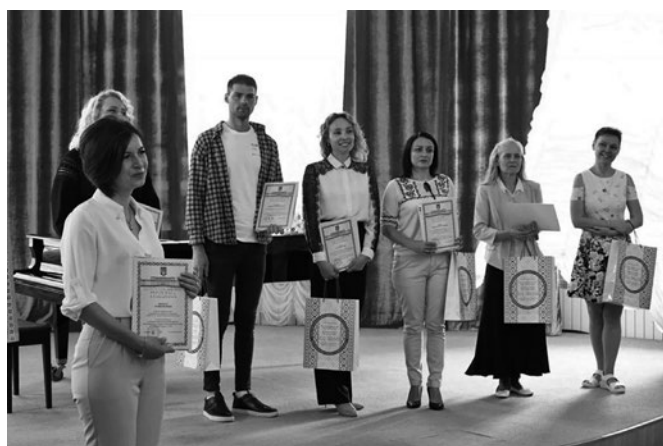
Урочисте нагородження переможців Всеукраїнського освітньо-методологічного відбору “РодовідУчитель”

Із метою виявлення та поширення кращого досвіду дистанційного навчання в закладах загальної середньої освіти Інститутом спільно з громадською організацією “РОДОВІДСВІТ” проведено Всеукраїнський освітньо-методологічний відбір “РодовідУчитель – 2023”. Учасниками професійного змагання стало 477 педагогічних працівників закладів загальної середньої освіти.