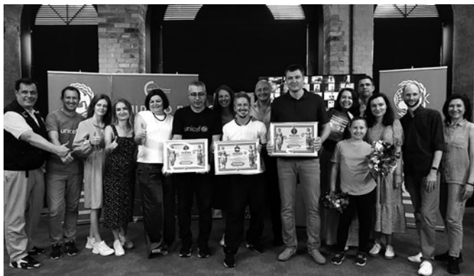
Українські вчителі фізичної культури встановили рекорд із проведення масових онлайн-уроків

Для підвищення фізичної активності дітей під час навчального року, зниження рівня тривожності й зміцнення здоров'я проведено конкурс на кращу організацію форм фізичної активності. У конкурсі взяло участь 750 закладів загальної середньої освіти та більше ніж 20 тисяч дітей.